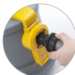
Innesto tubo a baionetta