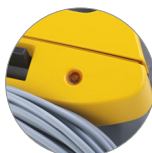
Spia riempimento sacchetto