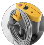
Cavo sganciabile da 15 metri