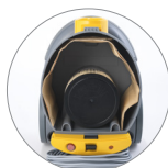
Vano interno di grandi dimensioni