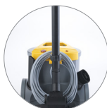
Attacchi tubo posteriore