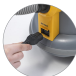
Presca per elettrospazzola