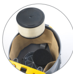
Filtro protezione motore + filtro a cartuccia HEPA