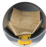
Sacchetto carta (optional)