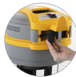
Prese ingresso e uscita aria raffreddamento motore