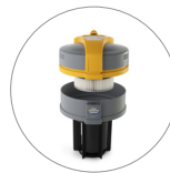
Ultra FilteRing System