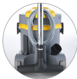
Dispositivi di sostegno accessori